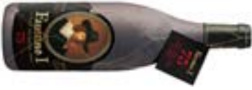
Faustino I Gran reserva Aniversario 75cl. ....29,50 Rioja Tempranillo